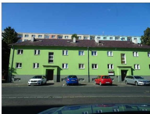
Obr.4 Stavební objekt v ulici Chomutovská

Dílčí změna č. 3 (DZ3): Jedná se o dům v ulici Chomutovská, jehož využití jako komerční vybavenost je dlouhodobě nanaplněno (ve městě jsou jiné plochy, které dostatečně naplňují poptávku), z toho důvodu jsou přeřazeny do ploch BH (vzhledem k charakteru objektu-viz obr.4) s plánovaným využitím pro bydlení.