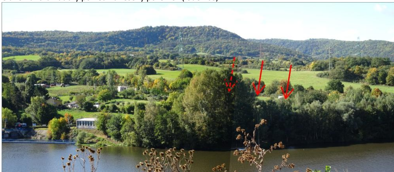
Obr.3 Panoramatický pohled na řešený pozemek (loděnice)

Dílčí změna č. 3 (DZ3): Jedná se o dům v ulici Chomutovská, jehož využití jako komerční vybavenost je dlouhodobě nanaplněno (ve městě jsou jiné plochy, které dostatečně naplňují poptávku), z toho důvodu jsou přeřazeny do ploch BH (vzhledem k charakteru objektu-viz obr.4) s plánovaným využitím pro bydlení.